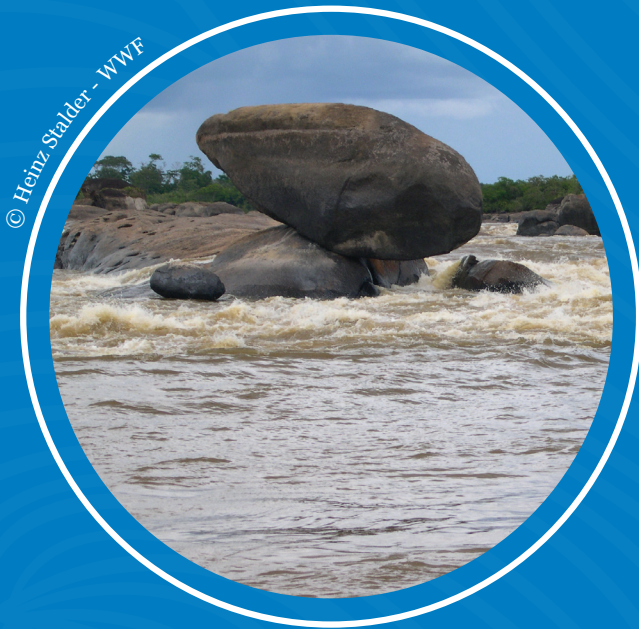
Raudales de Maipures en el Parque Nacional El Tuparro

Aunque existen registros históricos sobre la rica biodiversidad de la cuenca del Tuparro, es necesario contar con más información actual y sistemática para el monitoreo. Además, la información sobre certificaciones agrícolas-pecuarias no es consistente para toda la región, no se logró información suficiente sobre el estado de valores culturales vinculados con el río, pesquerías y estado de recursos hídricos en áreas protegidas, para incluirlos en el reporte actual, por lo cual, permanecerán como temas a tratar en reportes posteriores.