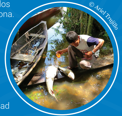
Monitoreo de poblaciones de peces en el Parque Nacional Natural el Tuparro.

Hace cinco años, varias comunidades indígenas del Parque Nacional empezaron a trabajar en procesos de monitoreo de peces en la zona. El proyecto ha tenido tanta acogida que ahora 13 comunidades suman esfuerzos para reconocer su riqueza en biodiversidad y gracias a su trabajo se han identificado los recursos pesqueros de la zona. En el 2013, gracias al éxito del proyecto, la UNESCO financió lo que sería el plan piloto del actual programa de monitoreo. Para 2020, se busca involucrar a las 11 comunidades restantes en la caracterización y protección de la biodiversidad del Parque.