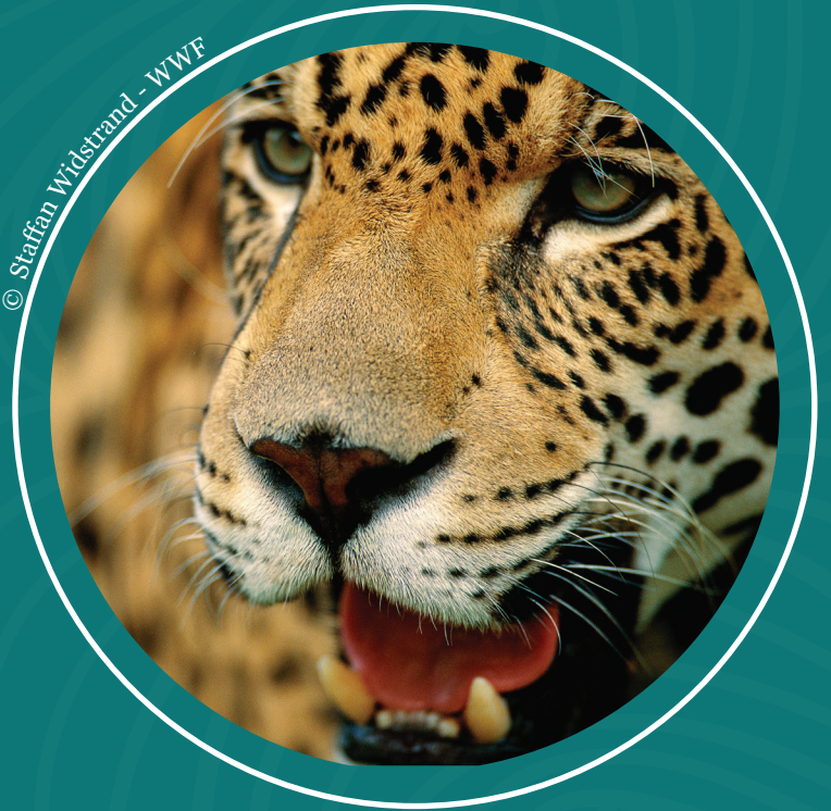
El subcuenca de Matavén alberga especies como el jaguar.