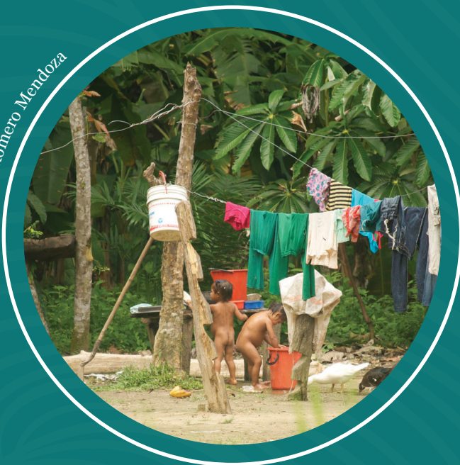
Un pueblo indígena en el Matavén.